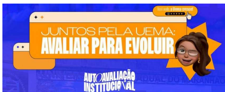
Figura 2 – Banner do evento "Juntos pela UEMA: Avaliar para Evoluir".

A Figura 2 apresenta o banner de divulgação do evento “Juntos pela UEMA: Avaliar para Evoluir”, utilizado como material institucional de sensibilização. A Figura 3 apresenta o material de divulgação durante a campanha da Autoavaliação Institucional 2025.