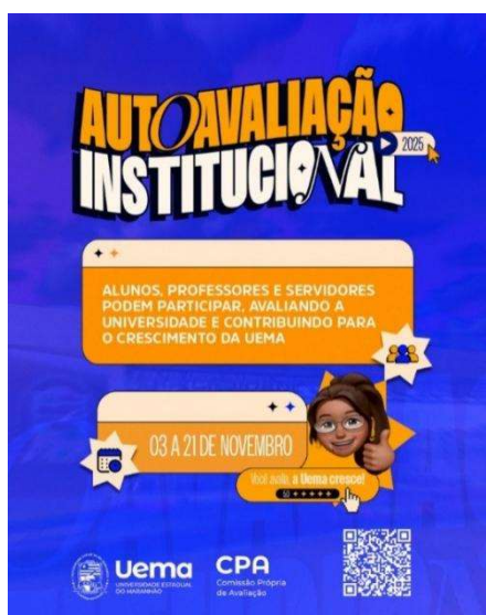
Figura 3 - Exemplo de material de divulgação da Autoavaliação Institucional UEMA 2025.