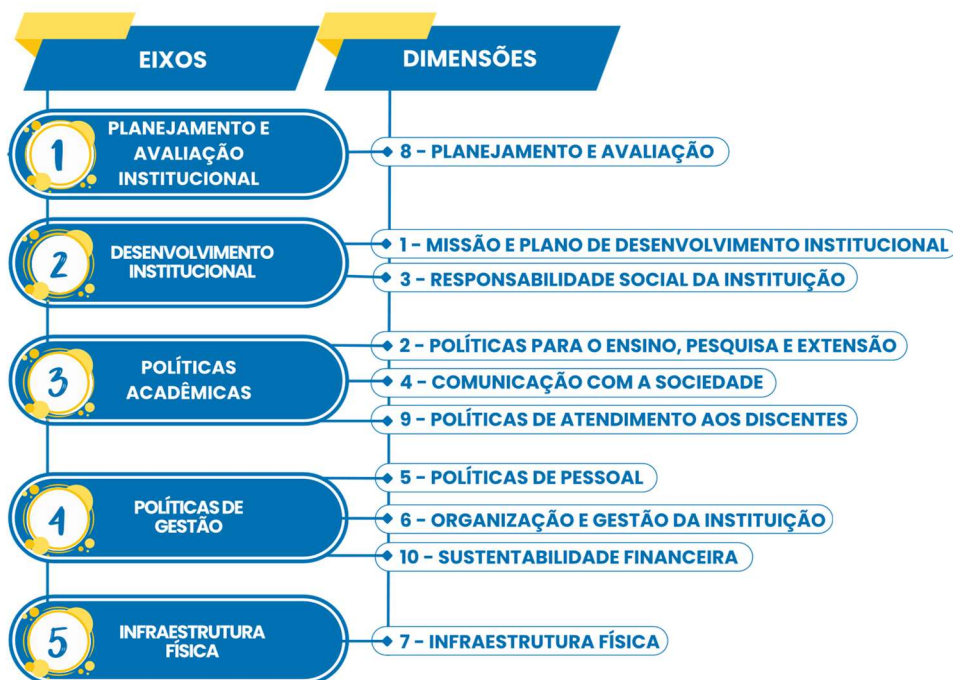
Figura 1 - Eixos e dimensões da Autoavaliação Institucional UEMA 2025.